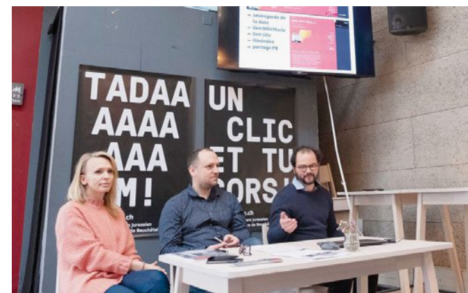
Culturoscope a été présenté hier à l'Interlope à Neuchâtel. B.PYTHON

L'agenda culturel Culturoscope s'étend à l'ensemble de l'Arc jurassien, puisqu'une section neuchâteloise a été ouverte hier. Cette nouvelle plateforme, réalisée par et avec les acteurs culturels, permet de rechercher des événements culturels de la région.