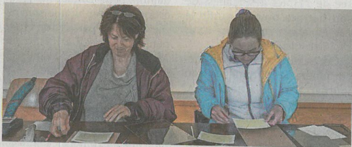
Un atelier de cyanographie avait déjà eu lieu lors de la Fête de la Nature cet été.