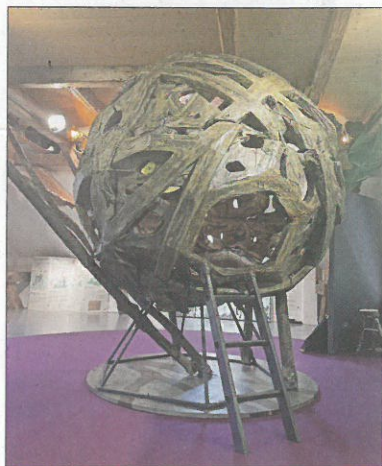
Les expositions présentées cette saison seront gratuites dimanche.

C'est le food-truck Oli's Food qui assurera la restauration, des pop-