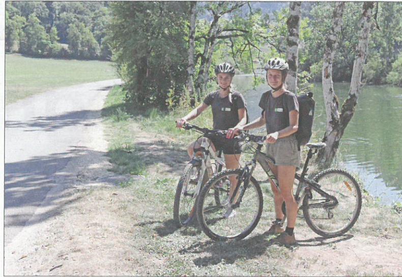
Les guides nature n'avaient jamais autant abordé de visiteurs avant cet été. Au cours de leurs tournées, ils ont recensé quelque 17 600 personnes autour des étangs taignons, ainsi qu'au bord du Doubs. Un record depuis le début de l'opération en 2021.

La formation des guides nature est assurée par le Parc du Doubs,