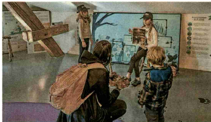
Les élèves des Enfers se sont mués en guides le temps d'une journée.

«grâce à ça, on se gêne moins de parler en public». «Je crois que j'aurai plus de facilité pour le spectacle de fin d'année.» Et tous se réjouissent bien sûr d'avoir reçu comme salaire une casquette estampillée Parc du Doubs et un bon pour se restaurer et boire un sirop. PJN