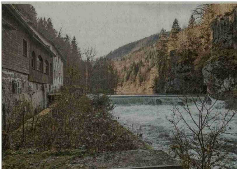
Les positions des deux camps sont toujours très tranchées à propos du barrage du Theusseret.

paysage est une thématique forte et émotionnelle qui touche à l'identité même des habitants et des usagers. LQJ