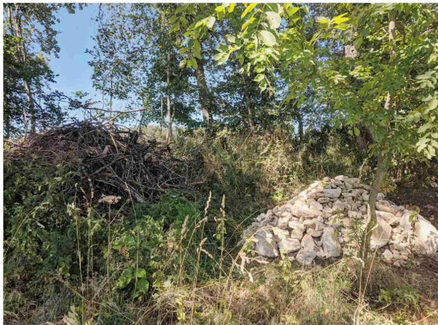
Les tas de bois et tas de pierres, ici sur une exploitation aux Enfers, sont construits avec des matériaux récoltés à proximité des lieux d'installation.

nets. Huit communes membres du Parc, soit la moitié d'entre elles, ont pour l'instant bénéficié du projet: Clos du Doubs, Les Enfers, Les Genevez, Montfaucon, Saignelégier, La Chaux-de-Fonds, Le Locle et Les Brenets. Des petites structures continueront de voir le jour en 2020. L'accent sera mis sur le plateau des Franches-Montagnes et des Montagnes neuchâteloises afin de permettre à tous les agriculteurs du parc de bénéficier de ces coups de pouce à la biodiversité. C-MPR