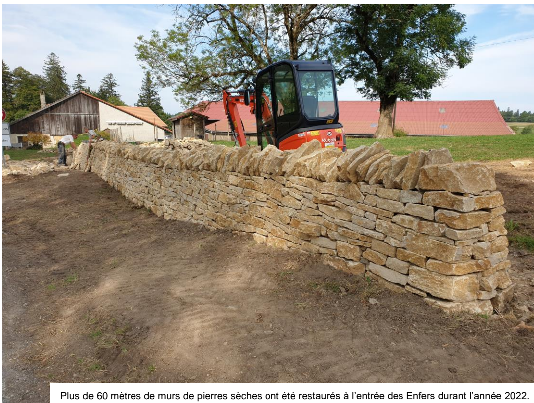
Plus de 60 mètres de murs de pierres sèches ont été restaurés à l'entrée des Enfers durant l'année 2022. Les travaux vont se poursuivre en 2023.