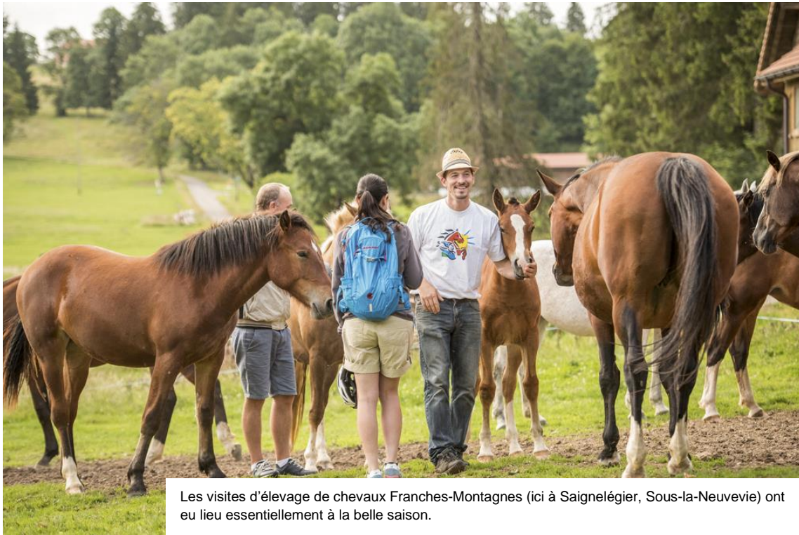
Les visites d'élevage de chevaux Franches-Montagnes (ici à Saignelégier, Sous-la-Neuvevie) ont eu lieu essentiellement à la belle saison.