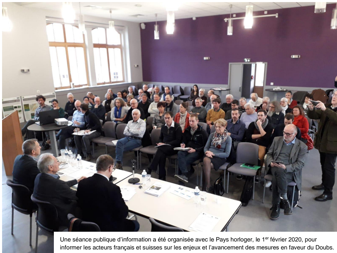
Une séance publique d'information a été organisée avec le Pays horloger, le 1 er février 2020, pour informer les acteurs français et suisses sur les enjeux et l'avancement des mesures en faveur du Doubs.