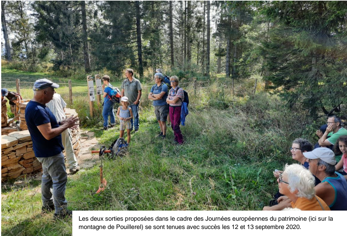
Les deux sorties proposées dans le cadre des Journées européennes du patrimoine (ici sur la montagne de Pouillerel) se sont tenues avec succès les 12 et 13 septembre 2020.