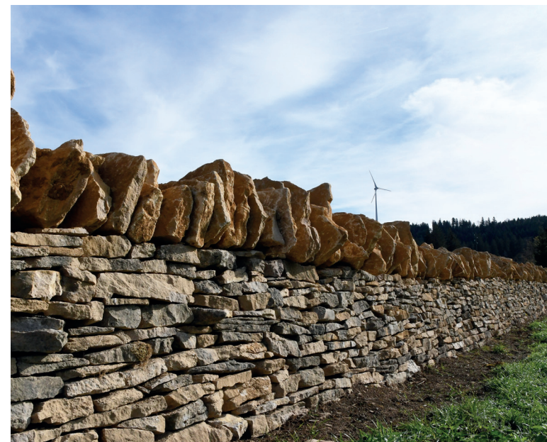
Groupe de travail interservices « Pierre sèche », avril 2018.