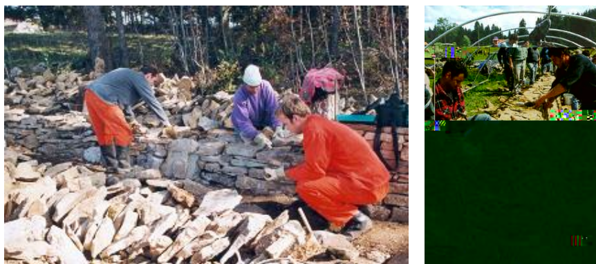
Figure 5 : Chantiers de restauration de murs de pierres sèches organisés par l'ASMPS 8