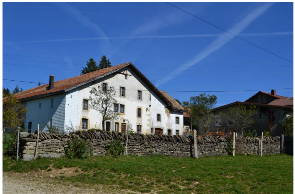
Figure 8 : Mur de pierres sèches protégé du bétail par une clôture en fil barbelé (Les Ecarres)