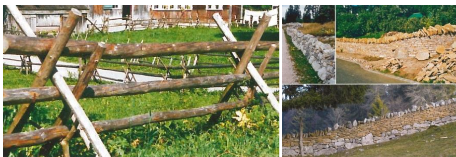
Figure 1 : Barrière en bois ou barre de couche (à gauche) et différents aspects du mur de pierres sèches (à droite) 2

D'un point de vue structurel, le mur libre de pierres sèches se caractérise par l'absence de liant (mortier, ciment, chaux) ainsi que par un socle de 70 cm de large et une hauteur de 120 cm en forme de trapèze. Il est surmonté d'une couronne de 40 cm où les pierres plates sont posées sur la tranche et dressées à la verticale. Selon Beuret, Méry et al. (2009, page 17), le mur de pierres sèches peut se présenter sous trois aspects : un mur construit avec des pierres de la roche-mère affleurant à proximité, un mur réalisé avec des pierres provenant de couches géologiques situées ailleurs (dalle nacrée), un mur constitué de matériaux pierreux mélangés (des blocs massifs trouvés à proximité servent de base à la construction et le reste de l'ouvrage est réalisé en dalle nacrée).