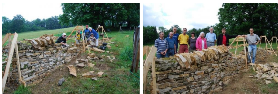
Figure 7 : Chantier de formation organisé en 2009 aux Pommerats par la FAFE 9