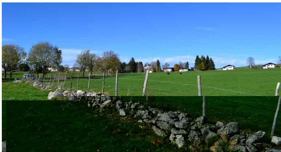
Figure 4 : Mur de pierres sèches surmonté d'une clôture en fil barbelé et fil électrique (Montfaucon)