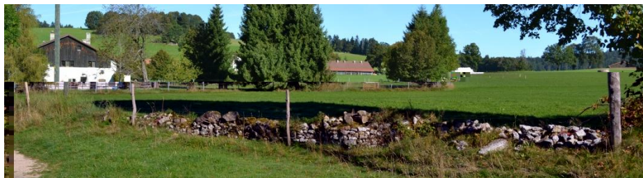
Figure 3 : Mur de pierres sèches envahi par la végétation (Muriaux)

Comme le soulignent Beuret, Méry et al. (2009, page 142), le mur de pierres sèches est rassembleur et éclectique. Il renvoie à l'organisation du territoire et à l'organisation sociale, à l'histoire, aux pratiques agricoles et sylvicoles, de même qu'à la biologie, l'écologie et l'éthologie, voire encore à l'économie, au tourisme, au sport et aux loisirs. La promotion et la sensibilisation à la qualité de ce patrimoine deviennent ainsi fondamentales. Il s'agit également de garantir la transmission des connaissances des artisans de la maçonnerie à sec et désignés par le terme de muretier, muraillier ou murailler.