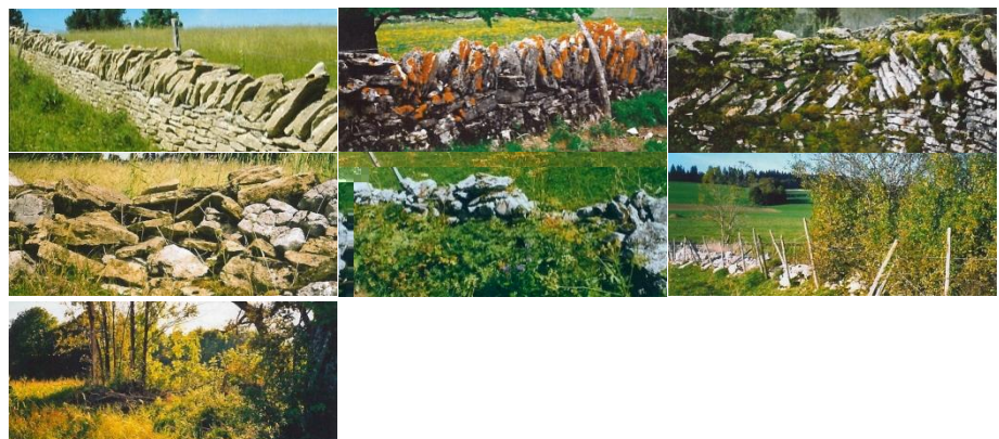
Figure 2 : Evolution naturelle du mur de pierres sèches 4

Par le passé, l'entretien des murs était assuré par les agriculteurs en particulier durant les « mois creux ». La modernisation de l'agriculture, caractérisée par de puissantes machines agricoles, de grandes surfaces d'exploitation et des objectifs de rentabilité croissants, considère malheureusement les murs de pierres sèches davantage comme des obstacles et des infrastructures onéreuses et chronophages. Sans entretien, ce patrimoine vernaculaire disparaît peu à peu en laissant la nature reprendre sa place. En effet, après l'apparition de lichens et de mousses s'ensuit l'introduction de végétaux toujours plus importants (fleurs, arbustes, arbres) 3 . Aujourd'hui, sur le territoire jurassien, l'entretien de ce patrimoine repose essentiellement sur les propriétaires acquis à cette cause ainsi que sur certaines associations, dont en particulier l'Association pour la Sauvegarde des Murs de Pierres Sèches (ASMPS). Créée en 1994 et forte de près de 300 membres, elle œuvre à la préservation et la restauration de ce patrimoine historique et culturel.