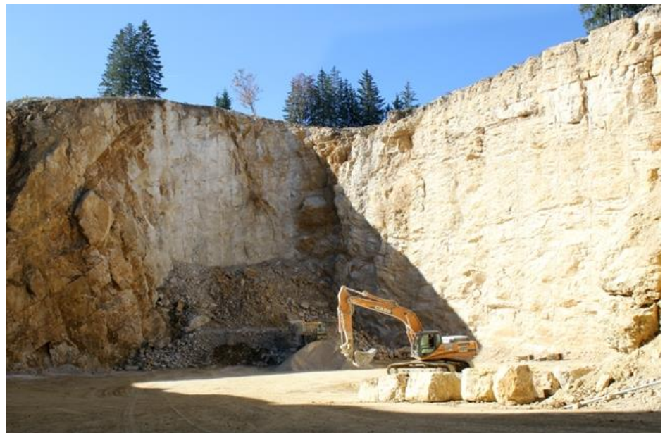
Figure 9 : Extraction de matériaux dans une carrière